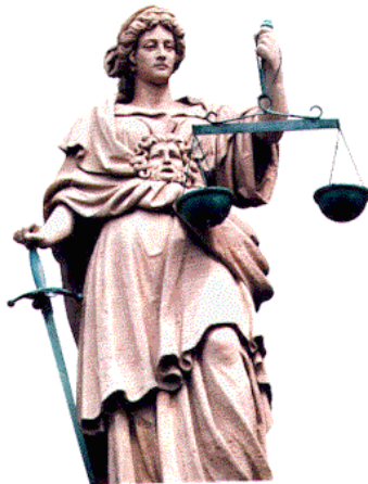
Vrouwe Justitia, godin van de rechtvaardigheid.