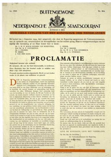
De Staatscourant: hier staan alle nieuwe wetten in.